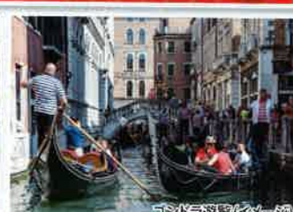
ゴンドラ遊覧(イメーシ)

ルネサンス美術の最高峰の呼び声高いボッティチェリの「ビーナスの誕生」を所蔵するウフィッツィ美術館を訪れます。※作品は貸出中などによりご覧いただけない場合があります。