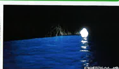
青の洞窟(イメーシ)

高速船でナポリからカプリ島へ渡り、マリーナ・グランデ(港)で船に乗り換えて青の洞窟を目指します。洞窟の入口はとても小さいので、手こぎボートに乗り換えて、いざ青の洞窟内部へ内部では外から差し込む光が水面を照らし、神秘的に輝く青い海面が広がります。※天候や波の高さによって入場できない場合があります。その場合の代案に付いてはP.5をご覧ください。青の洞窟入場確率(参考:2018年5月~10月 カプリ島船頭共同組合統計による)5月 65% 6月 47% 7月 71% 8月 84% 9月 73% 10月 35%