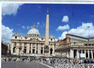
サンピエトロ大聖堂

世界中の旅行者が訪れる大人気観光スポット。後ろ向きにコインを投げ入れると、ローマに再訪できると言われています。