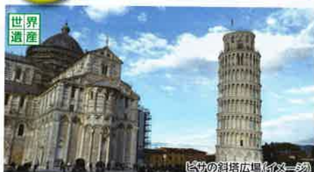
ピサの斜塔広場(イメーシ)