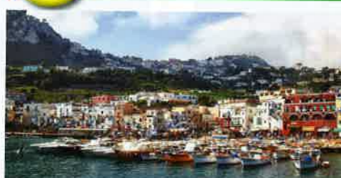
マリーナ・グランデ(イメーシ)