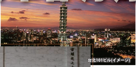
台北101ビル(イメージ)