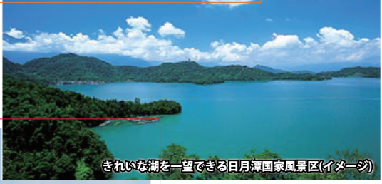
きれいな湖を一望できる日月潭国家風景区(イメージ)