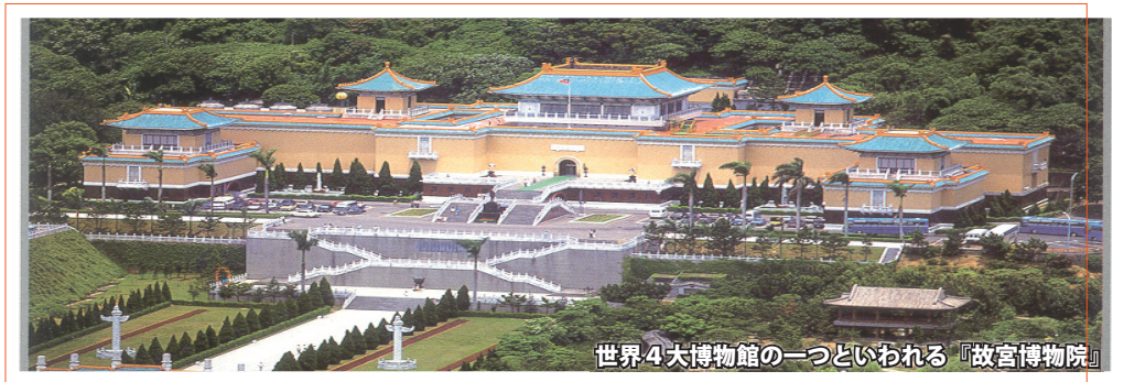
世界4大博物館の一つといわれる『故宮博物院』